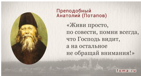
Преподобный Анатолий (Потапов)

«Живи просто, по совести, помни всегда, что Господь видит, а на остальное не обращай внимания!»