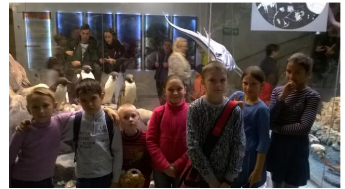
21 октября дети Воскресной группы посетили Государственный Дарвиновский музей.

Исповедь совершается накануне Божественной литургии и Всенощного Бдения.