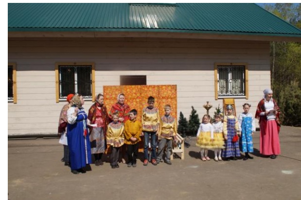
Выступление учащихся Воскресной школы на Пасхальном празднике 1 мая 2016 г.

Исповедь в нашем храме совершается в субботу и воскресенье на Божественной литургии, а так же каждом Всенощном бдении.